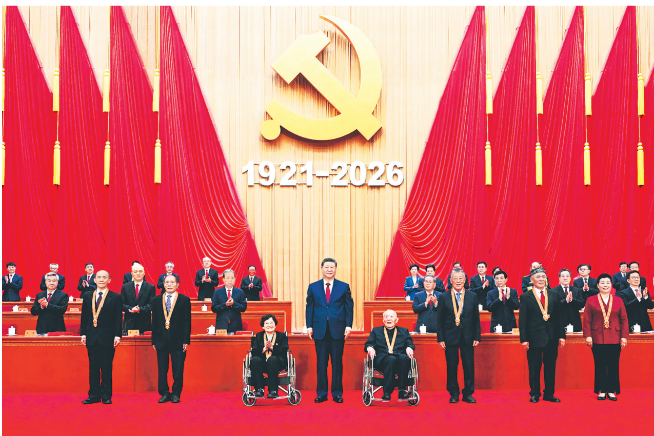
7月1日上午,庆祝中国共产党成立105周年大会在北京人民大会堂隆重举行。中共中央总书记、国家主席、中央军委主席习近平向“七一勋章”获得者颁授勋章。

新华社北京7月1日电 庆祝中国共产党成立105周年大会7月1日上午在北京人民大会堂隆重举行。中共中央总书记、国家主席、中央军委主席习近平向“七一勋章”获得者颁授勋章并发表重要讲话。他强调,105年来,我们党始终坚守为中国人民谋幸福、为中华民族谋复兴的初心使命,在不懈奋斗中创造了彪炳史册的伟大成就。新征程上,全党同志要