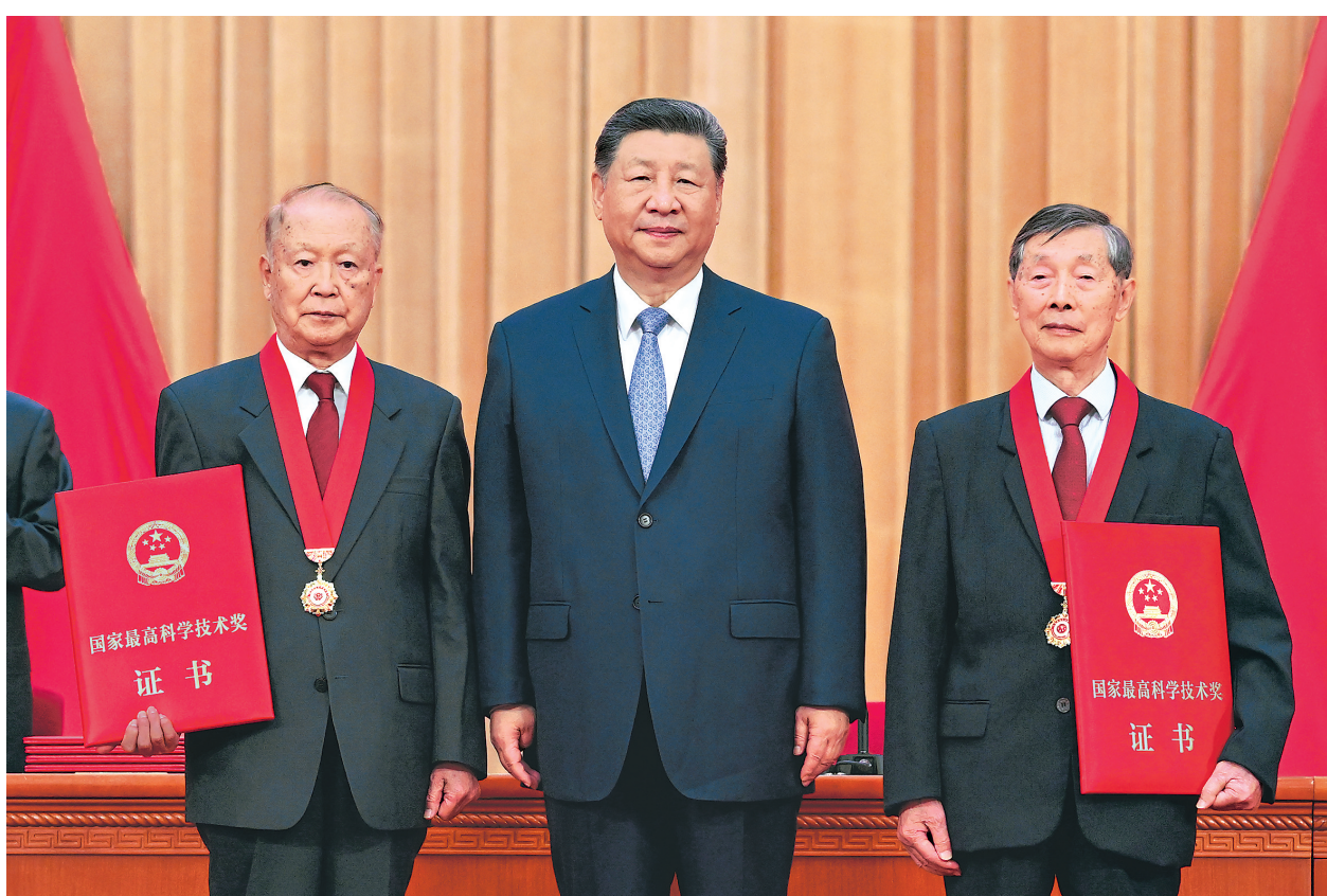
● 7月8日上午，国家科学技术奖励大会、中国科学院第二十二次院士大会和中国工程院第十八次院士大会、中国科学技术协会第十一次全国代表大会在北京人民大会堂隆重召开。中共中央总书记、国家主席、中央军委主席习近平出席大会并发表重要讲话。