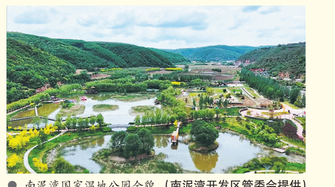
● 南泥湾国家湿地公园全景