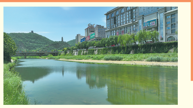
● 宝塔山下，延河水清岸绿

碧水奔流不息，生态画卷常新。站在全新发展起点，延安正以水为笔，奋力书写黄河流域生态保护和高质量发展的圣地新篇章，让清水长流、绿意长存、民生常暖。